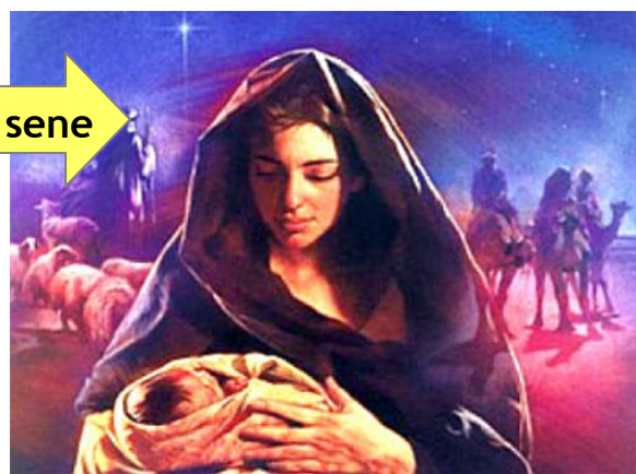
Иса'нън анась Мерйем 0 сенесинде

Демек, Мухаммед бурада айнъ адъ ташъян ики киши қаръштърдъ: Муса ве Харун'ун къзкардеши олан МИРЯМ ве Иса'нън аннеси олан МЕРЙЕМ.