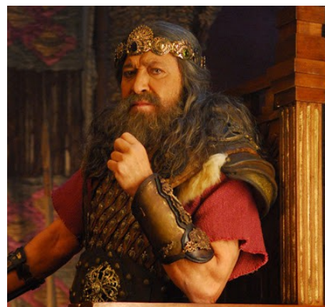
Саул Израил халкънън биринджи кралъ иди (Муса'дан 400 сене сонра)

Айръджа йукаръдаки Куран айети Израиллилерин кралларъндан съоз едийор. Халбуки, Израил'ин биринджи кралъ 'Саул' адънда бири иди, о да Муса'дан 400 сене сонра яшадъ. О замана кадар Израил'ин тек бир кралъ йокту, хер джинсин