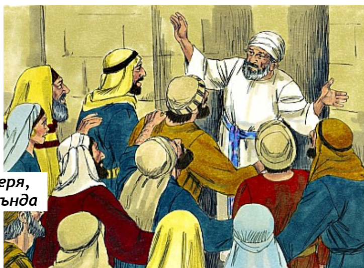
Яхя'нън бабасъ Зекеря, акрабаларънън арасънда

Евет, бютюн бу 'Йоханан'лар = 'Яхя'лар, пейгамбер Яхя'дан йюзлердже сене Ыондже яшадълар. Хатта, гьордююмюз гиби, Яхя чок яйгън, сьрадан бир ад иди. Теврат'ъ окумамъш олан бир киши ичин ъойле бир хата япмак мюмкюндюр; ама гюя 'Аллахън сьозю' олан бир китап ичин бу дюшюнүлмездир.