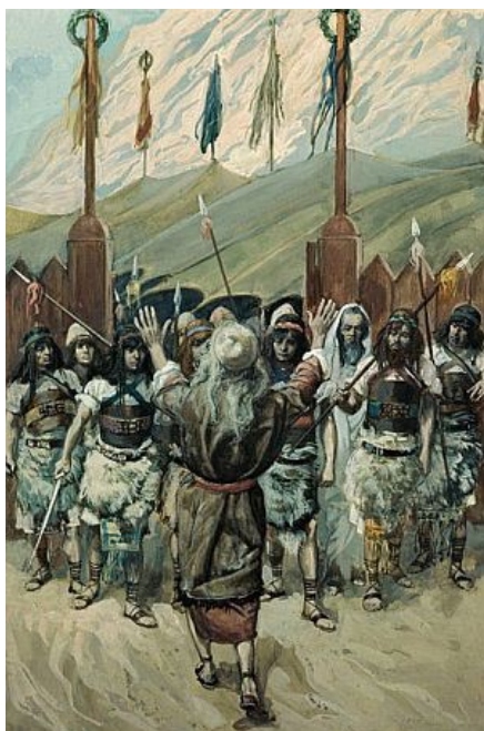
Корах (Карун) Мъсър'да икен деил, ама сонра чьолде икен Муса'я каршъ аякландъ.

Куран, Муса'нън хаятъ юзеринде чок дуруйор; онун Мъсърлъ Фиравун'ла каршълашмасънъ узун узун анлатъйор. Халбуки, буну япаркен бир сюре тарихсел янлъшлъклар япъйор. Мухаммед Куран'ъ язаркен, Теврат китабънда булуна олайларъ садедже кенди амачларънъ герчеклештир-мек ичин матерял оларак кулландъ. Бунун амаджънъ да ашаъда анлайджаъз.