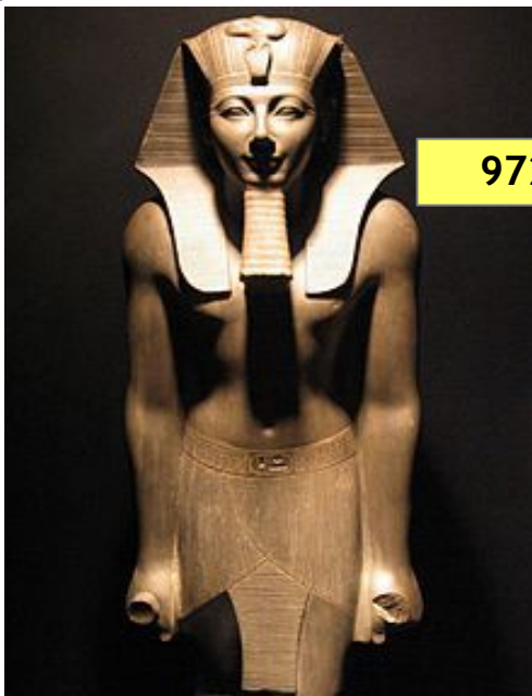
Муса'нын заманъндаки Фиравун - III. Тутмосис ( -1446 сенеси)

Бизим ичин шашъртъджъ олан шу ки, насъл Куран гене бир кишинин хаятънън ен ьнемли билгилеринден хаберсиз олуп ону башка йере, башка замана 'трансфер' едийор. Хаман Мъсърда яшамадъ, Мезопотамя'да яшадъ (бирбирлеринден 1200 км узак), Муса'нын заманънда яшамадъ, ондан 1100 сене сонра яшадъ.