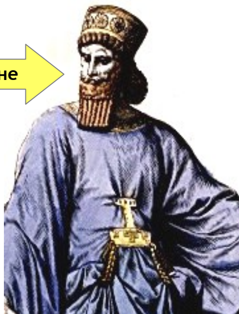
Иран кралъ Ахошверош'ун везири, Хаман ( -474 сенеси))