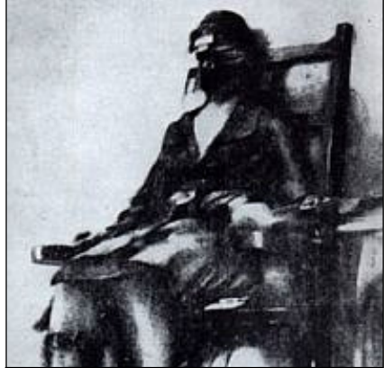
Etel Rosenberg – 1953 yılında casusluk için idam edilmiş bir amerikalı kadın

Ama eski peygamberlerden her ne kadar günaha düşenler olduysa da, hiç kimse Muhammed’in yaptığını yapmadı: hiç kimse Allahın sözlerinin arasına Şeytanın sözlerini katmadı. Hepsi Şeytan tarafından alandı diyebiliriz, ama hiç kimse Şeytanın sesini Allahın sesiyle karıştıracak kadar düşmedi. Peygamber de olsa, her insan hata yapacak kadar zayıftır, her türlü günaha düşebilir, ve