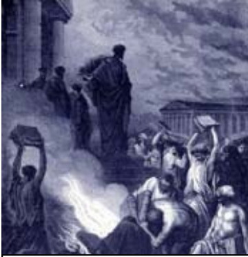
Efes'te büyücüler İsa'yı kabul edip kitaplarını yaktılar

"Tam o sırada havrada bulunan ve kötü ruha tutulmuş bir adam, "Ey Nasıralı İsa, bizden ne istiyorsun?" diye bağırdı. "Bizi mahvetmeye mi geldin? Senin kim olduğunu biliyorum, Tanrı'nın Kutsalı'sın sen!" İsa, "Sus, çık adamdan!" diyerek kötü ruhu azarladı. Kötü ruh adamı sarstı ve büyük bir çılgılık atarak içinden çıktı" (İncil – Markos 1:23-26).