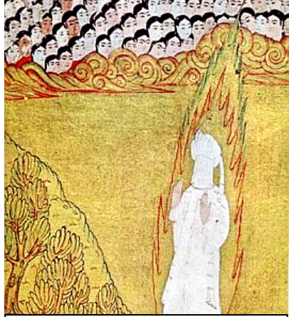
Muhammed'e Hira mağarasında görünen kimdi?

Kutsal Kitap'taki tanrının birçok ünvan ve genel adları vardır – ama tek bir özel adı var: YAHVE. Her Yahudi, her Hristiyan onun adını biliyor ve o adla ona saygı gösteriyor. Oysa Muhammed, bütün Araplar gibi, onun adını bilmezdi. Kendi taptığı Al-Lah tanrısının kendini eski peygamberlere tanıtan Yahve'nin olduğunu sandı, ama bu doğru değildir. Bütün Kuran'da bir kere olsun Yahve adı geçmiyor. Muhammed'e görünen ruhsal varlık gerçek Tanrının meleği değildi, yoksa onun adını anacaktı.